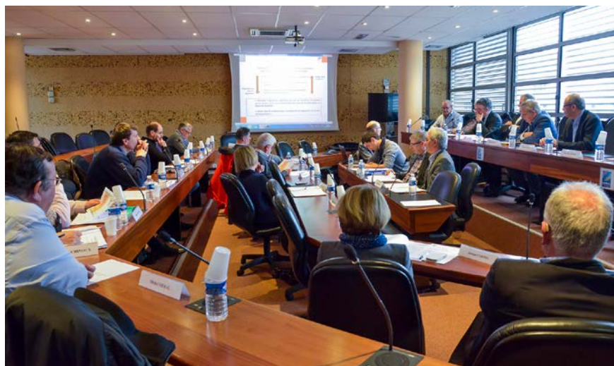
Réunion du Comité Syndical

Réponses du quizz : 2 : C - 3 : C - 4 : B - 5 : B - 6 : B