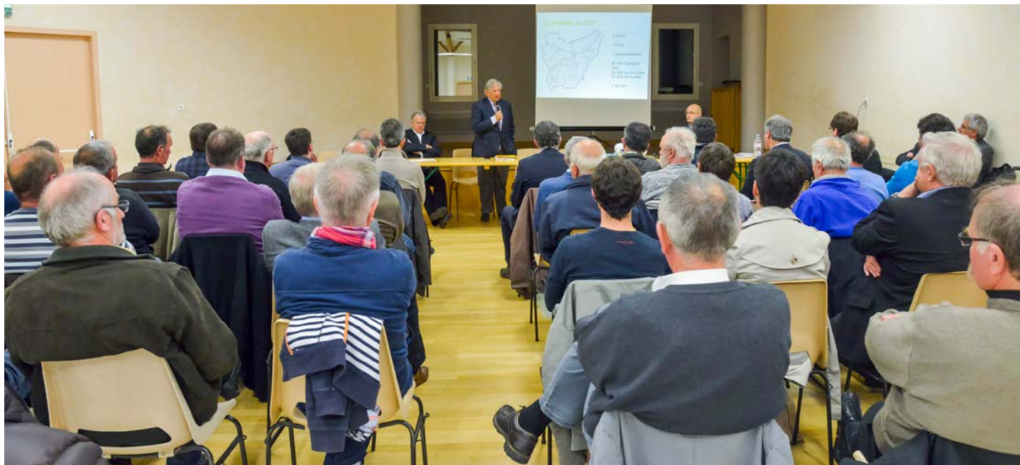
Réunion publique de présentation

Enfin, le SCoT est porteur d'objectifs de maîtrise de la consommation foncière, pour tendre vers une réduction d'environ un tiers de la consommation d'espaces naturels et agricoles. Poursuivre et dynamiser le développement du territoire en consommant moins de foncier : tel est l'objectif ambitieux recherché par le projet de SCoT.