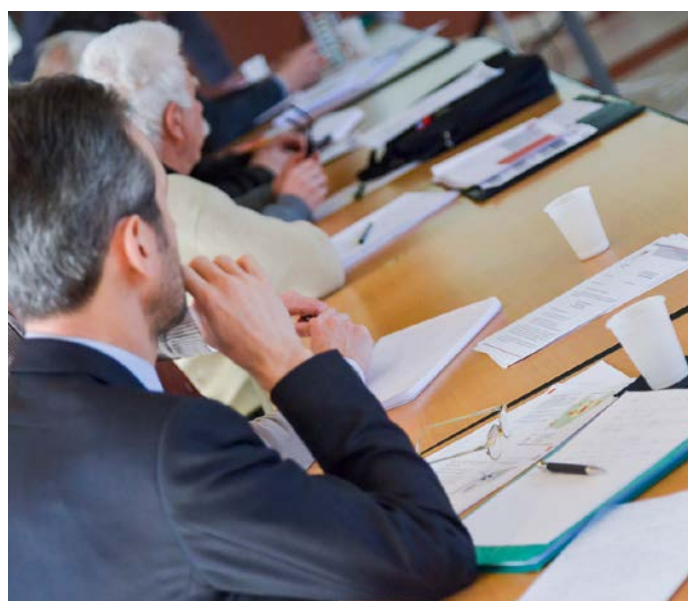
Atelier de travail

Pour répondre aux enjeux du diagnostic, le projet d'aménagement et de développements durables du SCoT est avant tout guidé par la volonté de développer l'attractivité territoriale. Le PADD est organisé autour de quatre axes qui visent tous à favoriser l'atteinte de cet objectif transversal d'attractivité territoriale.